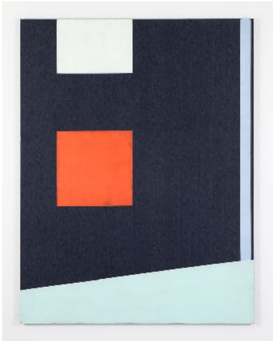
Matisse Window II , 2013 Acrílico sobre mezclilla 182.88 x 139.7 x 3.81 cm